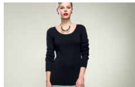
Dress | LE15307