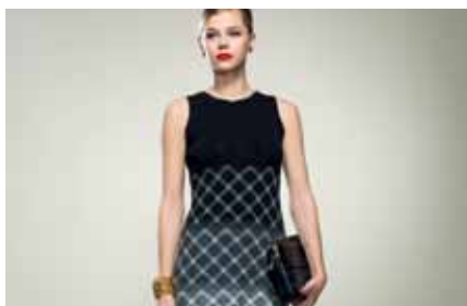
Dress | LE15305