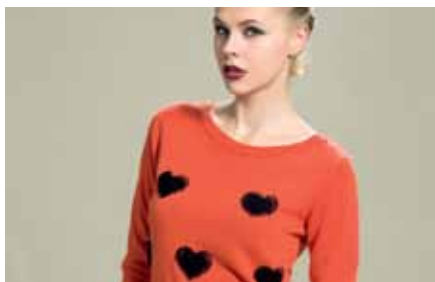
Pull | LE15310