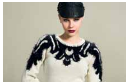
Pull | LE15303