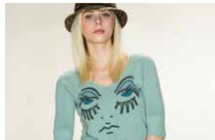
Pull | LE15343