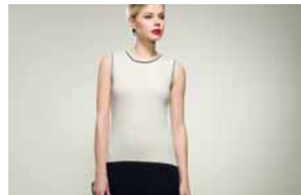
Dress | LE15301