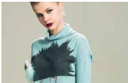
Pull | LE15323