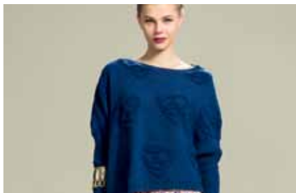
Pull | BN15409