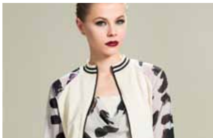
Bomber | GB15130 Top | GB15101