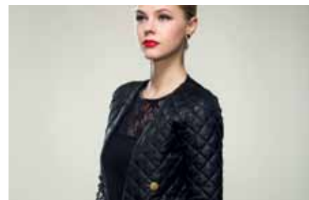
Jacket | SB15208