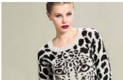
Pull | LE15347