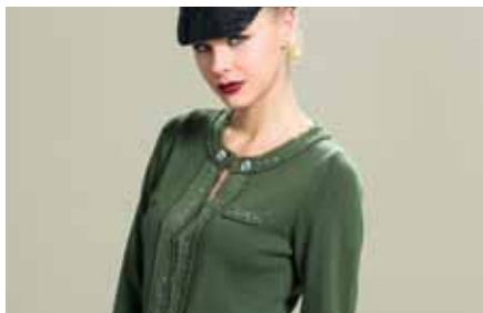
Pull | LE15344