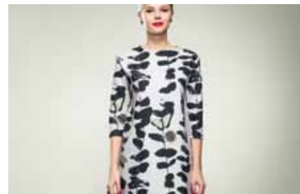
Dress | GB15120