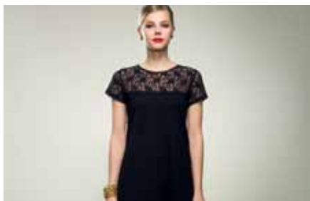
Dress | GB15160