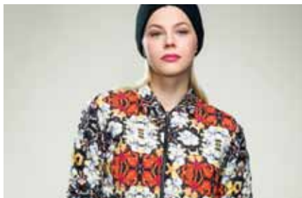
Bomber | GB15159 colour 39 stamp flores