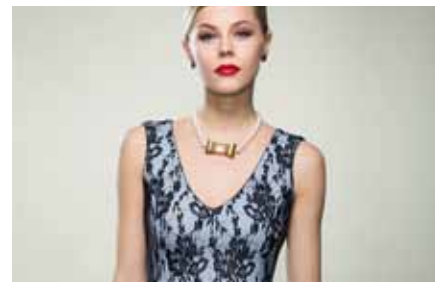
Dress | SB15206