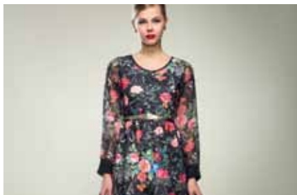
Dress | GB15110