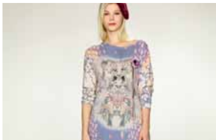
Maxi Pull | LE15320